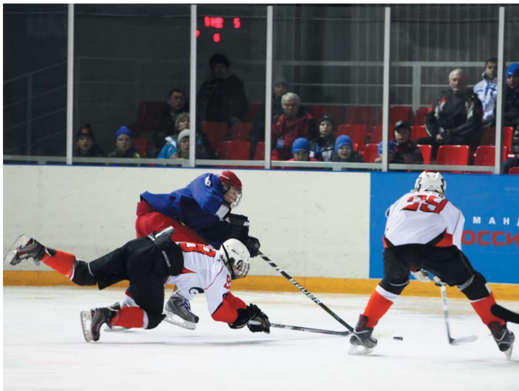
Москва (в синем) много атаковала, но победили хозяева

Со скуки начинаю зевать и даю установку — выступить в роли эксперта. С Надымом томичи отлично знакомы: с этой командой они провели свой самый напря-