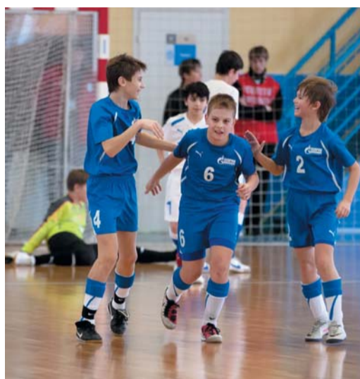
...чтобы потом отпраздновать победу,

На площадке тем временем сошлись команды «Газпром трансгаз» из Сургута и Москвы. Товарищи по несчастью: обе уступили Томску и потеряли шансы бороться за первое место. Оставалось решить, кто больше достоин «бронзы».