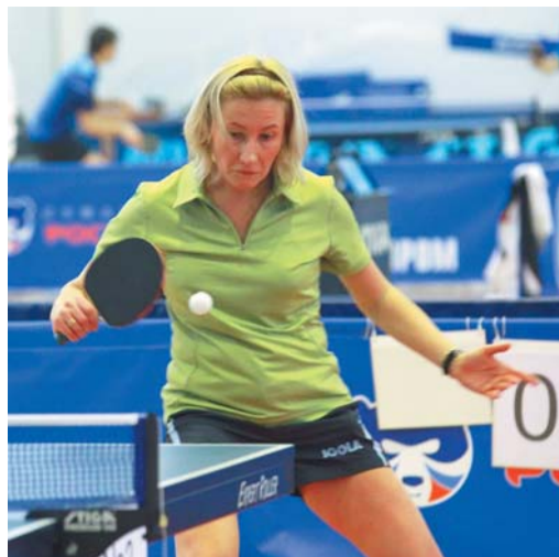
Укротить миниатюрный теннисный шарик бывает крайне непросто

Победно волжане начали и второй круг финальной пультки, обыграв команду Сургута со счетом 4:2. С аналогичным результатом Югорск взял верх над Екатеринбург. Еще один претендент на медали — столичный коллектив — всухую 4:0 одолел Ямбург. С каждым матчем напряжение на турнире возрастало. Правда, как выяснилось позже, решающая в борьбе