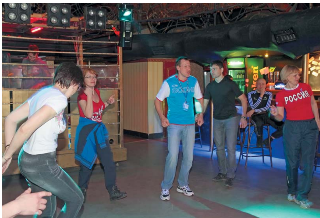
Танцуют все или кто еще в силах

— Решили поучиться играть в бильярд, — смеются они. — Женщины с кием смотрятся красиво, эротично! А там глядишь, и новый вид спорта освоим!