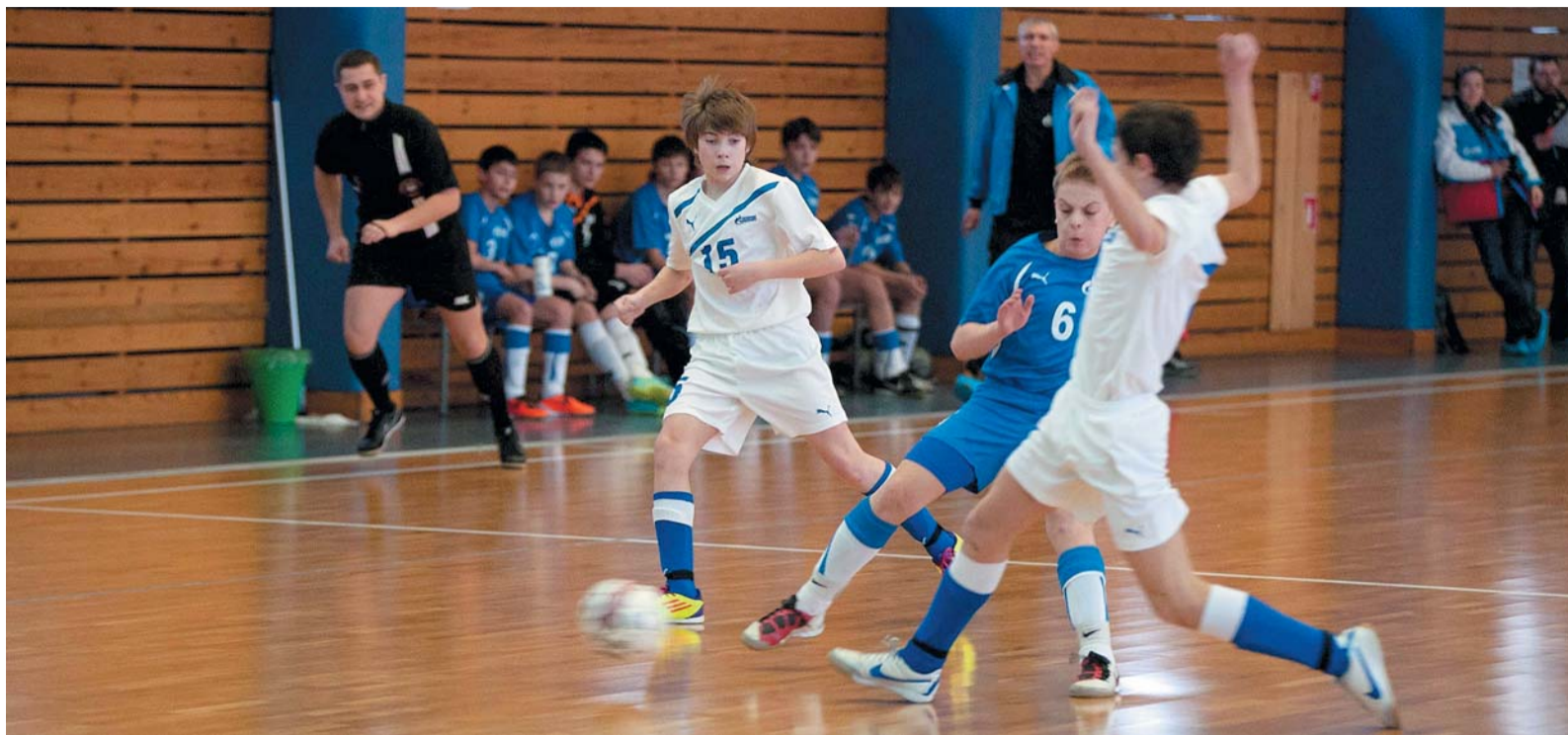
В мини-футболе нужно бороться до конца,

На IV детской зимней Спартакиаде ОАО «Газпром» юноши завершили групповой турнир по мини-футболу. Почти все вчерашние матчи в МФК «Синара» уже ничего не решали, но день не обошелся без борьбы, эмоций и рекордов. Запомнился он и первой нулевой ничьей в поединке претендентов на «бронзу».