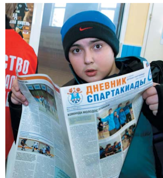
...а потом читать о себе в свежей прессе

Желание, увы, не сбылось. Матч Югорска и Ямбурга завершился с редчайшим для мини-футбола счетом — 0:0. Но по разнице забитых и пропущенных мячей второе место в группе заняли югорчане. И сегодня