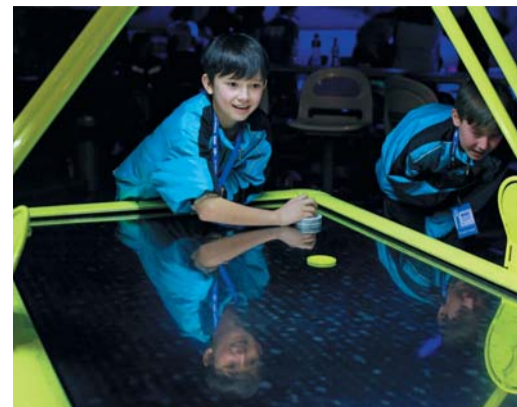
Была бы их воля, ребята бы каждый вечер развлекались