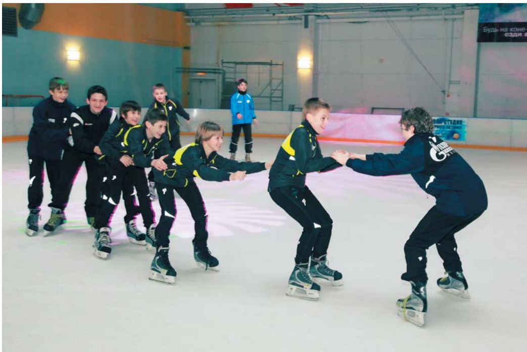
Московская команда и на катке держалась вместе

Первые матчи позади и можно немного расслабиться. Чтобы добавить положительных эмоций, ребята из Сургута, Краснодар, Уфы, Ямбурга, Москвы и Уренгоя отправились в развлекательный комплекс «Луна».