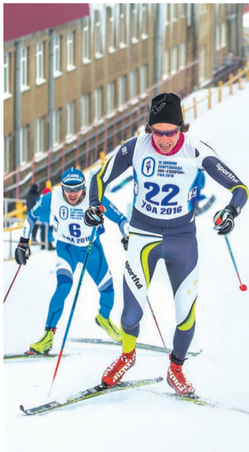
Вперед, к победе!