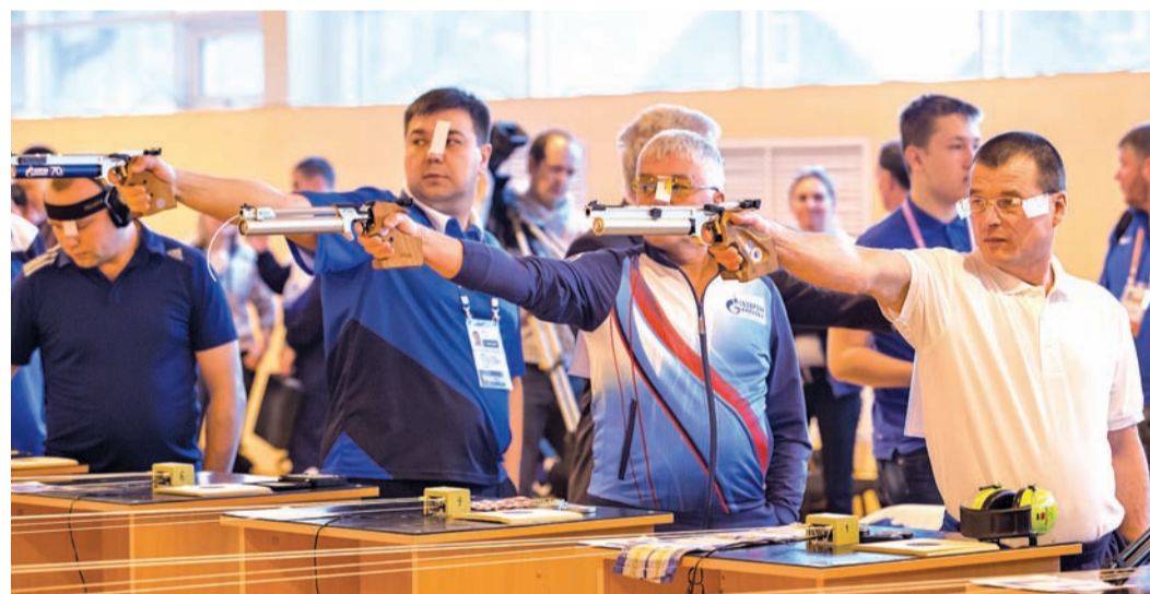
Пошла последняя минута

Пулевая стрельба – вид спорта, на первый взгляд, не совсем зрелищный. Стоят спортсмены у рубежа и стреляют, подтягивают мишени, меняют их на новые и снова стреляют. Сначала в течение десяти минут пробные выстрелы, затем – зачетные... Но этот вид спорта обладает своим внутренним драйвом.