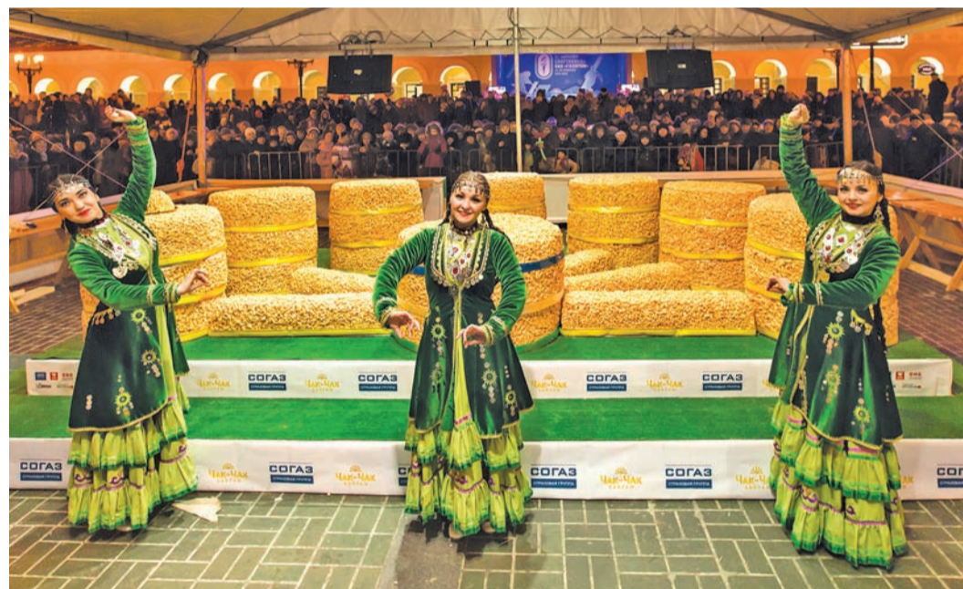
Праздничные гуляния продолжались до вечера