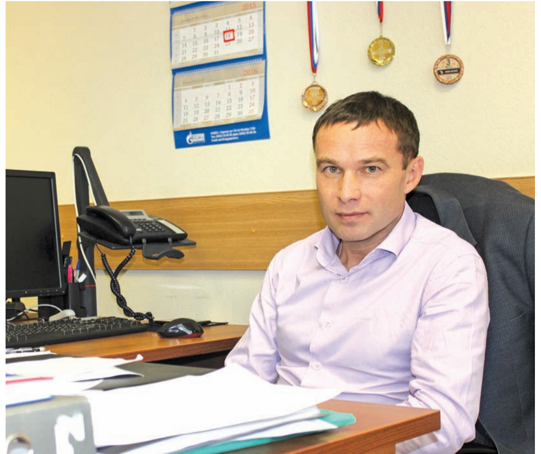
«Вешать кеды на гвоздь не собираюсь»