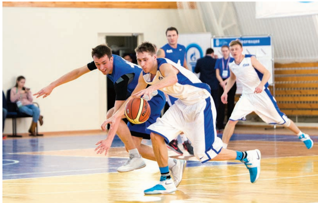
Борьба за мяч нецелочувствительная