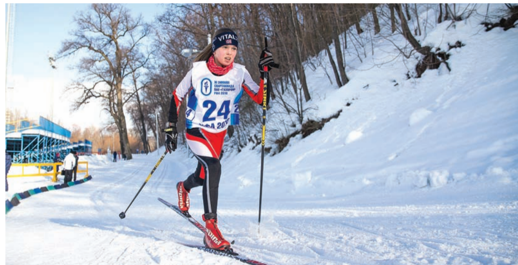
Трудный путь к финишу

Трасса на «Биатлоне» еще не успела остыть от взрослых участников лыжной гонки, как практически сразу показать свое мастерство вышли дети.