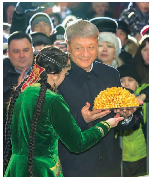
Чак-чак – символ единства

Башкирские кондитеры испекли чак-чак весом больше тонны