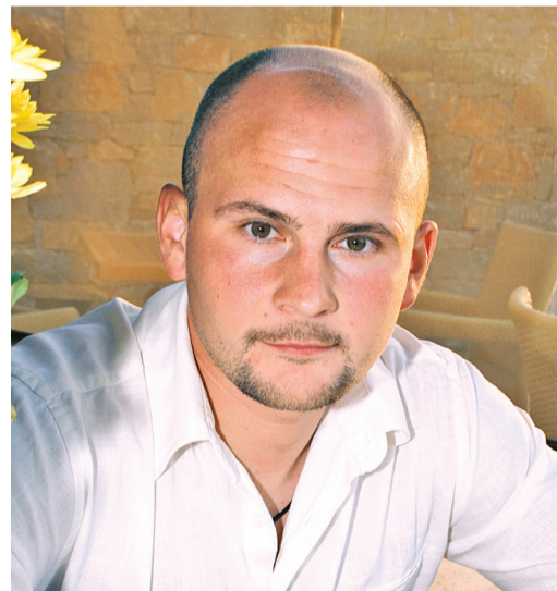
Из футбола не ушел