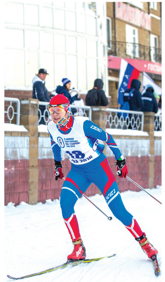
■ Последние метры