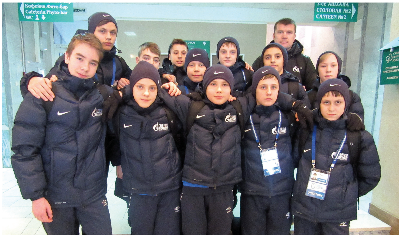
Спартакиада нас сплотила

Санаторий «Зеленая Роща» на эти дни стал детской резиденцией XI зимней Спартакиады «Газпрома». Юные спортсмены съехались из разных городов России.