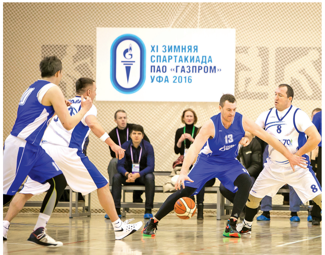
■ Борьба за мяч