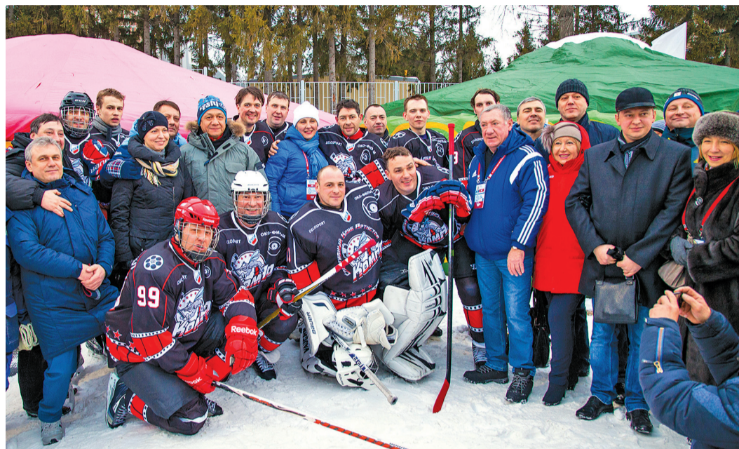
Игра получилась азартной

А также журналисты и спортивные комментаторы. Посмотреть на звезд театра и кино, телеведущих федеральных каналов с хоккейными клюшками можно было на серии товарищеских матчей на открытом стадионе Административно-управленческого комплекса «Газпром трансгаз Уфа».