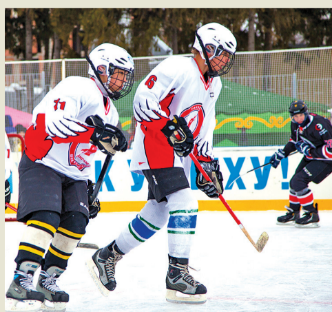
Школьники учились у кумиров

В перерывах между товарищескими матчами команд «Российская пресса», «КомАр» и ООО «Газпром трансгаз Уфа» прошел мастер-класс для детей Демской коррекционной школы.