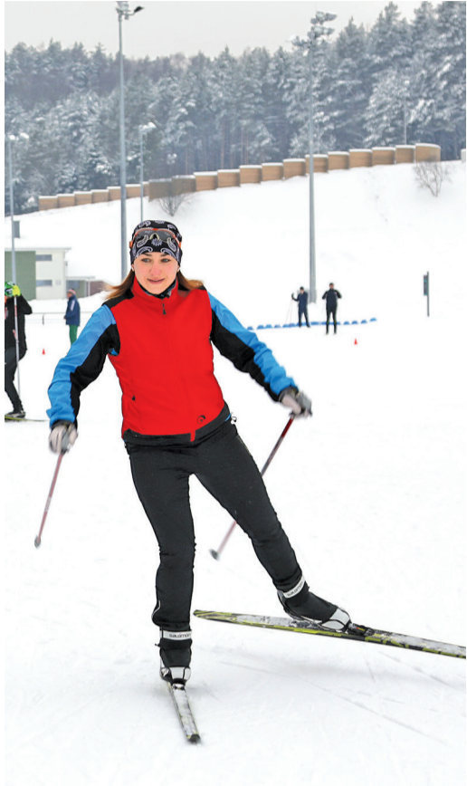
Лыжи заряжают энергией

Для команды белорусских лыжников подготовка к Спартакиаде в Уфе была не самой простой. Причиной этому стала капризная и непривычно теплая зима в Беларуси. Семь градусов выше нуля, легкий дождь – таким выдался декабрь. Только в канун Нового года на территории страны установилась по-настоящему снежная и морозная погода.