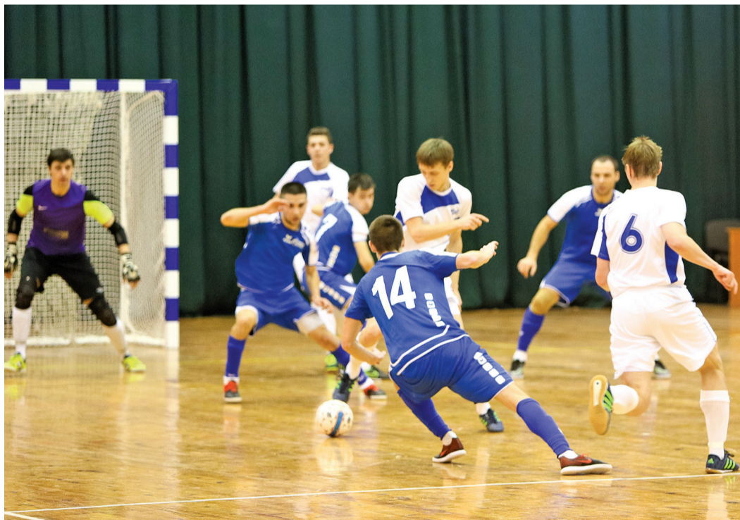
Опасный момент у ворот

Последний день группового турнира по мини-футболу среди взрослых получился нервным и крайне эмоциональным. Никто не хотел уступать, стараясь вырвать победу.