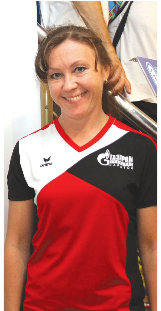
С улыбкой по жизни

Беседовал Владимир ПОСПЕЛОВ.