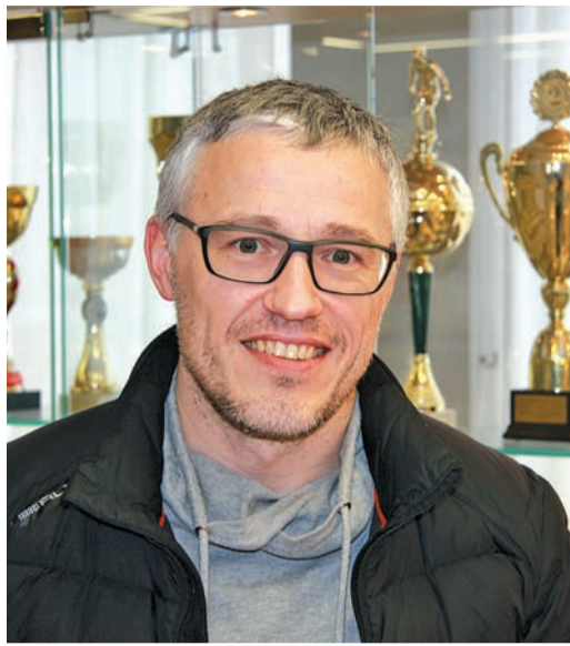
Учит брать новую высоту

Действительно, в Уфу едет Команда. Многие, конечно, сомневались в том, что за полтора месяца возможно объединить ребят из разных подразделений в сыгранный коллектив. Однако посмотрев, как внимательно футболисты слушают своего тренера, понимаешь, что руководитель знает, как нужно работать, чтобы команда стала единой.