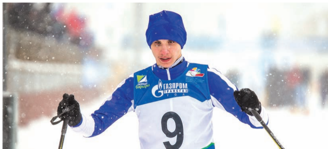
Надежда паралимпийского спорта

День финальных соревнований по лыжным гонкам Спартакиады ПАО «Газпром» на СОК «Биатлон» завершился важнейшим социальным мероприятием – впервые в Уфе прошел лыжный фестиваль среди детей-инвалидов. Организаторами выступили Министерство молодежной политики и спорта Республики Башкортостан и ООО «Газпром трансгаз Уфа».