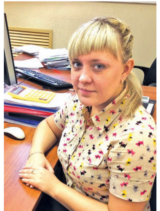
Абсолютная чемпионка 2007 года

Беседовал А. АЗАРКИН.