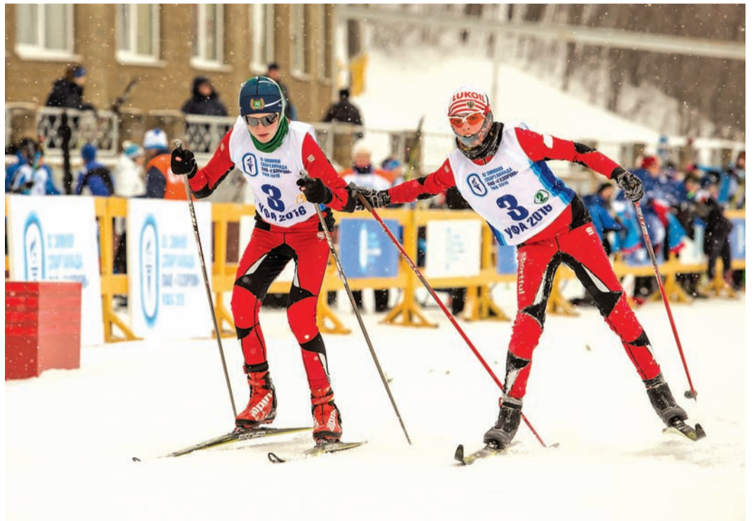
Все решает мгновение

часто бывает тепло, в отличие от Сургута. Но сегодня сильный ветер немного мешал бежать.