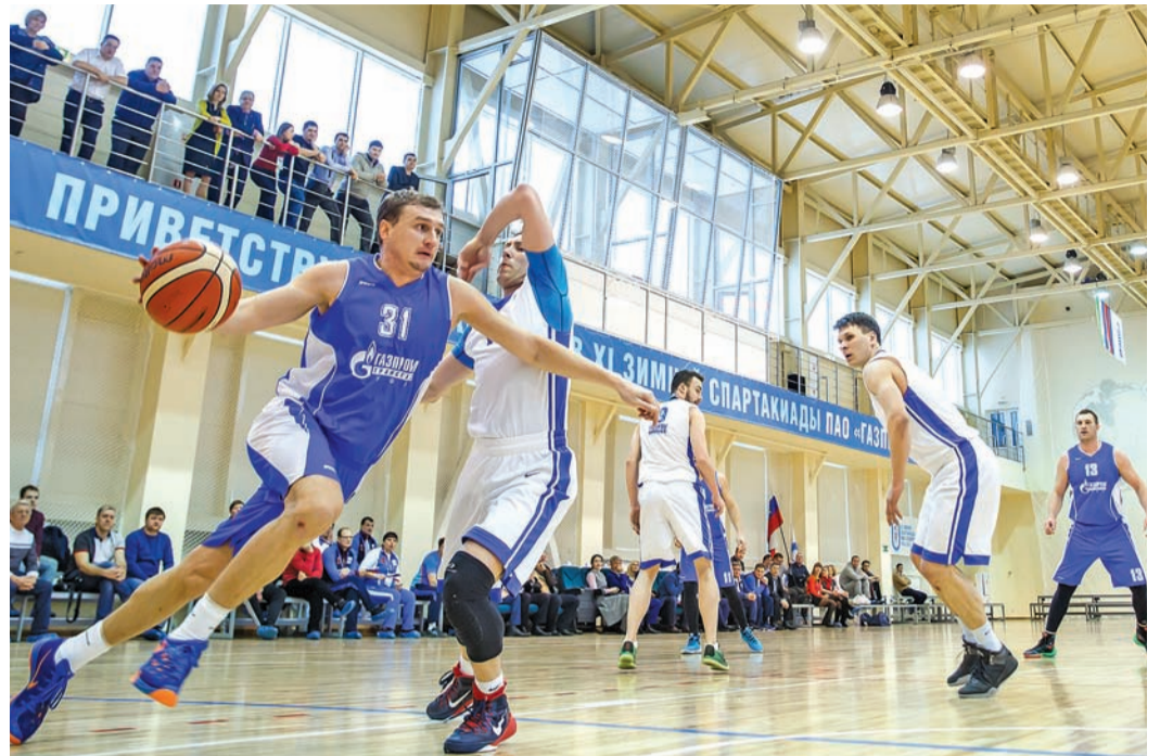
■ Настрой на выигрыш