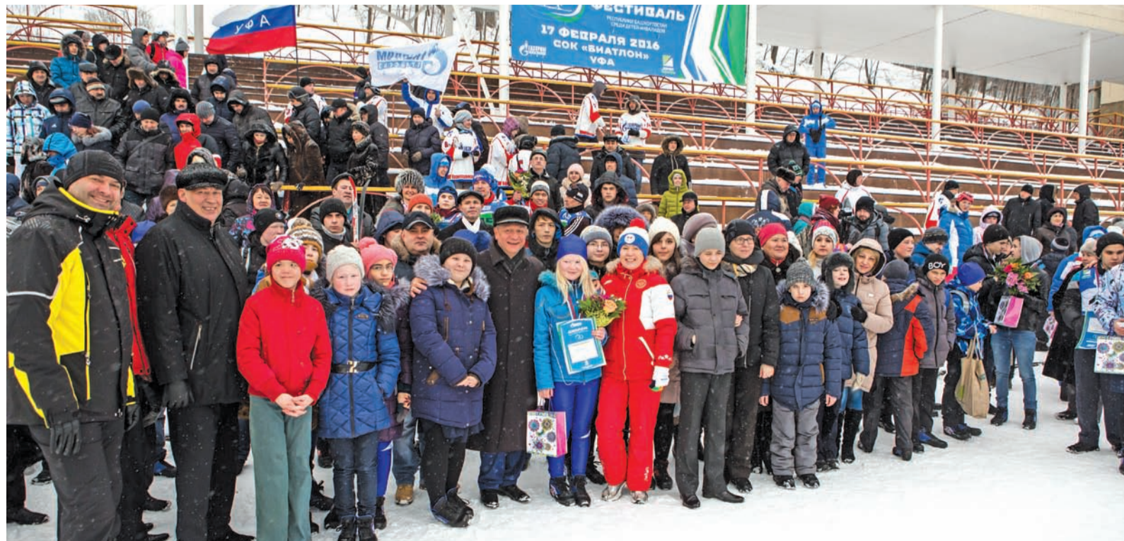
Фото на память о чудесном дне

детей с нарушением зрения приняли участие в республиканском лыжном фестивале