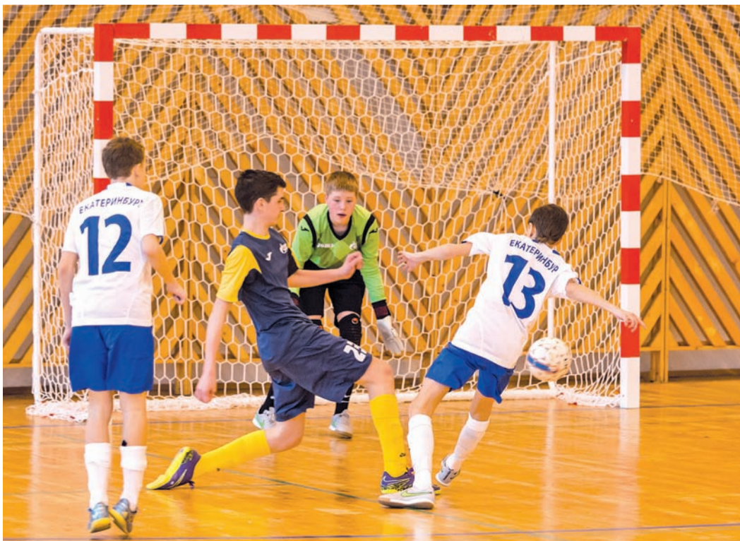
Игру показали боевую!