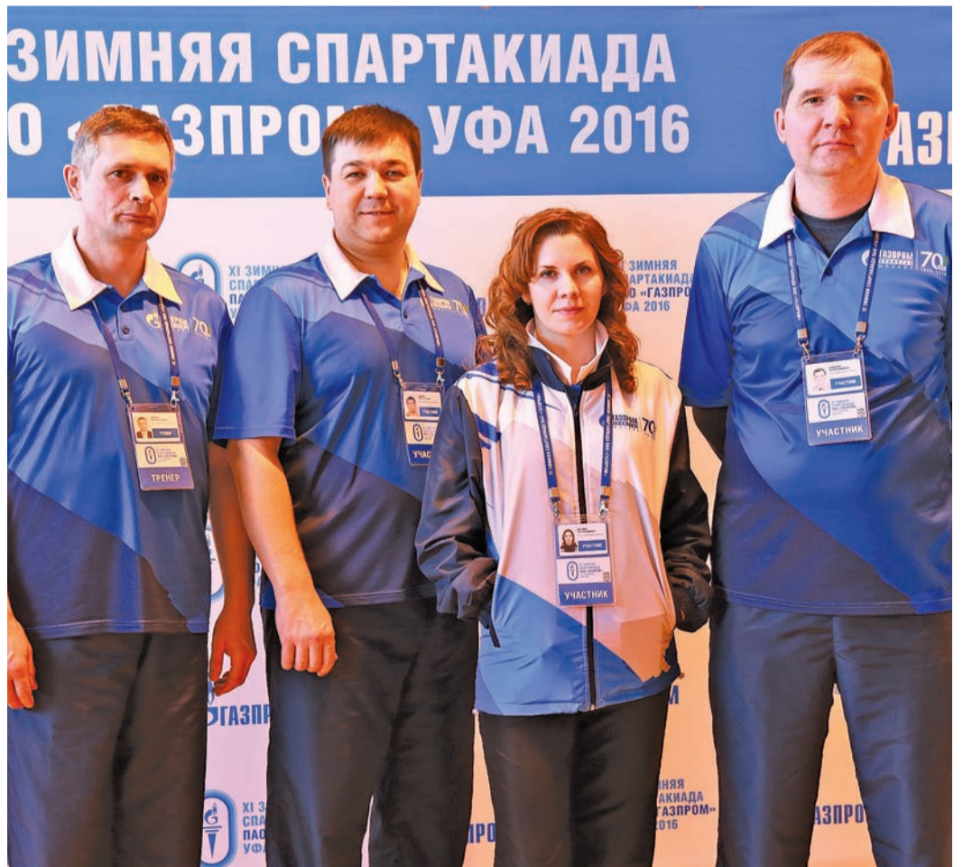
Стрелки со своим тренером

Отбор команды ООО «Газпром трансгаз Москва» по стрельбе из пневматического пистолета начался еще осенью 2015 года.