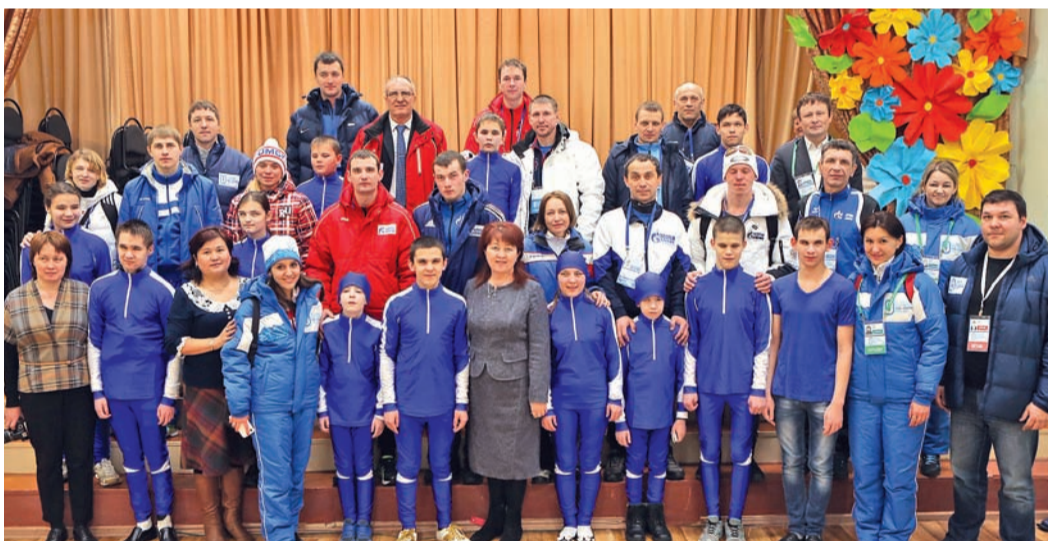
Эта встреча навсегда останется в сердцах детей