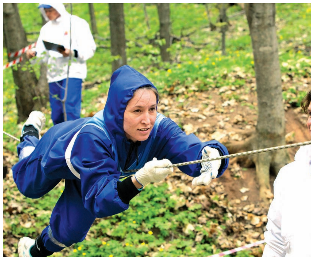
■ Тренировки круглый год

По материалам пресс-службы ООО «Газпром трансгаз Казань»