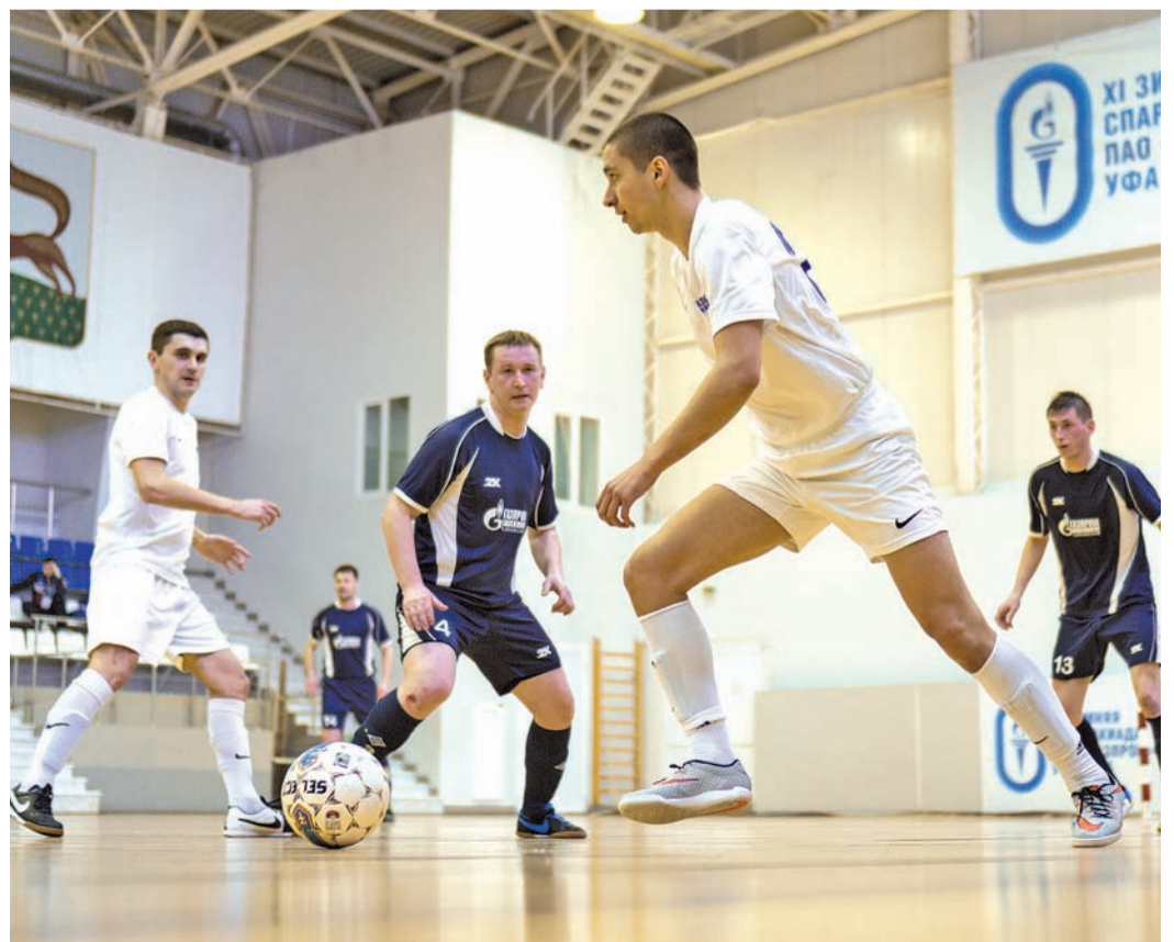
■ Ответственная игра