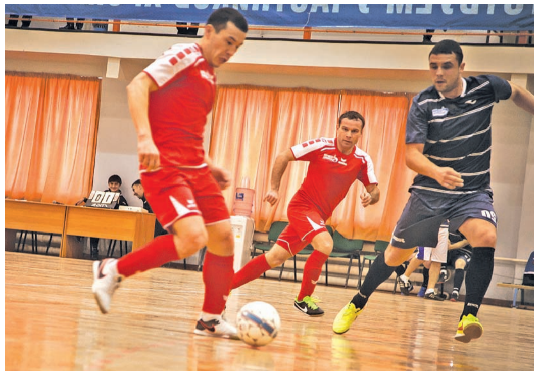
■ Бились до последнего