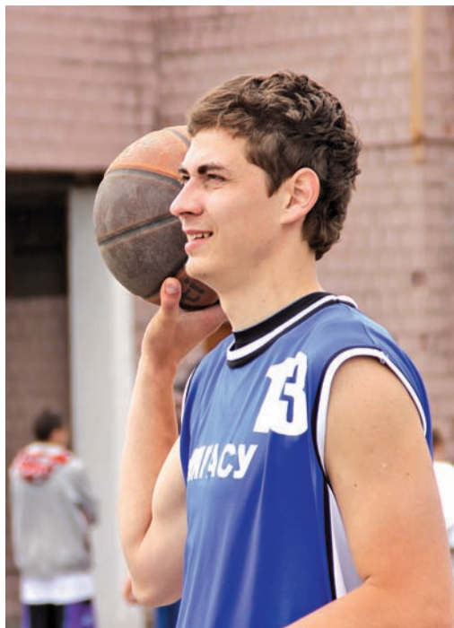
20 лет в баскетболе

По материалам пресс-службы ООО «Газпром трансгаз Нижний Новгород»