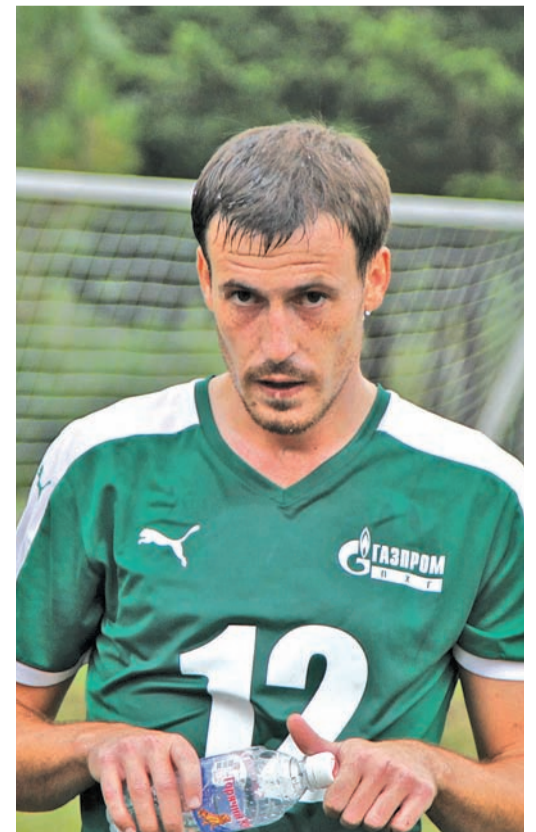
В футболе с семи лет

Беседовала Ольга ПОСАДСКАЯ.