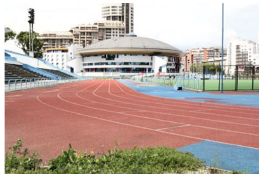
Стадион «Динамо» (ул. Еремина, 12)