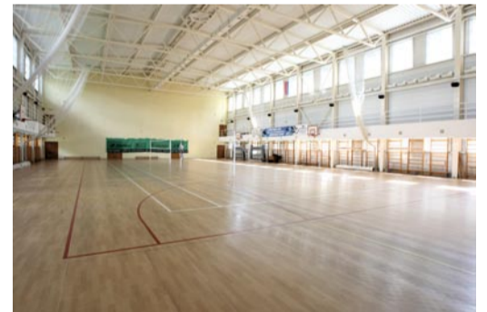
СДЮШОР «Виктория» (пр. Ленина, 68г)