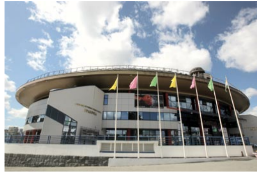
Дворец игровых видов спорта (ДИВС) «Уралочка» (ул. Еремина, 10)

Традиционным на базе СК «Изумруд» стало проведение волейбольных, теннисных, шахматных турниров российского и международного масштаба. Несколько лет подряд в «Изумруде» проходит областной турнир по теннису на кубок Губернатора Свердловской