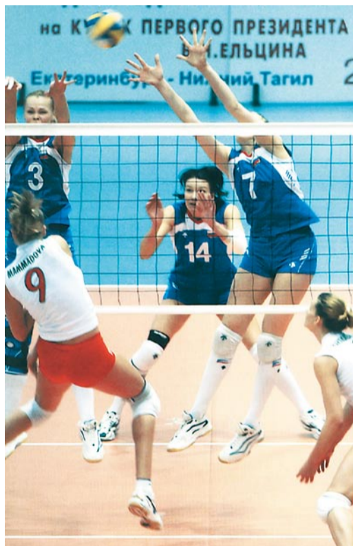
«Кубок Ельцина» в ДИВСе

Первым значительным спортивным объектом был екатеринбургский ипподром, введенный в эксплуатацию в начале XX века. В дореволюционный период в Екатеринбурге имелись футбольные поля, зимой на городском пруду у плотины расчищался лед и проводились занятия конькобежцев и фигуристов.