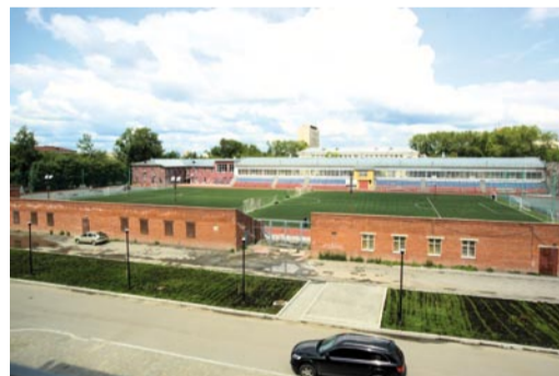
СКИВС УГТУ-УПИ (стадион, ул. Мира, 29)