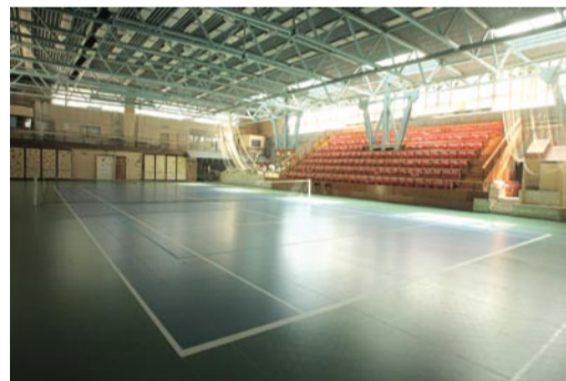
Спортивный комплекс «Изумруд» (ул. Сакко и Ванцетти, 38)