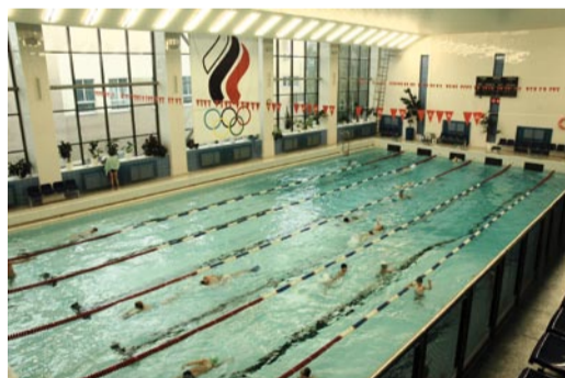
Спортивный комбинат «Урал» (ул. Камвузовская, 9)

«Виктория» является одной из крупнейших в Свердловской области: 18 видами спорта занимается свыше 2400 детей и подростков. В СДЮШОР «Виктория» открыты несколько спортивных отделений по разным направлениям: айкидо, адаптивная физическая культура (АФК), бадминтон, велоспорт, волейбол, гребля на байдарках и каноэ, дартс, дзюдо, конькобежный спорт, легкая атлетика, лыжные гонки, плавание, прыжки на батуте и акробатической дорожке, самбо, скалолазание, спортивная аэробика, спортивная гимнастика, художественная гимнастика.