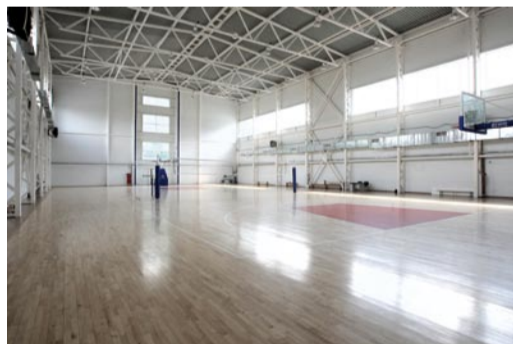
СКИВС УГТУ-УПИ (зал, ул. Софьи Ковалевской, 5)