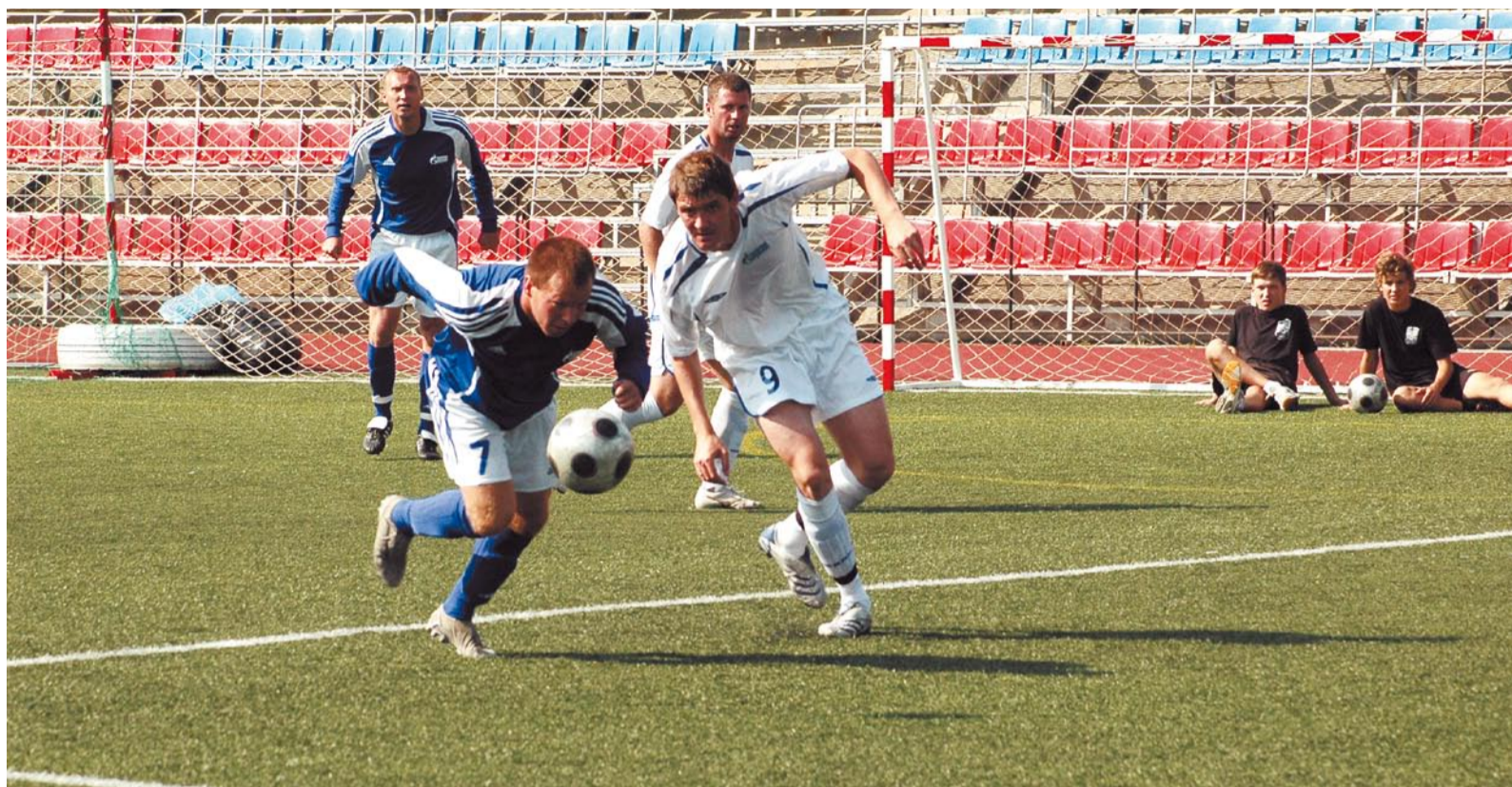
«Газпром добыча Ямбург» (в белой форме) — «Газпром трансгаз Сургут»

Утром 21 августа в матчах команд группы «А» «Газпром трансгаз Югорск» — «Мосэнерго» и «Межрегионгаз» — «Газпром трансгаз Томск» определятся два последних участника финального турнира восьми лучших футбольных команд Спартакиады 2009 года.