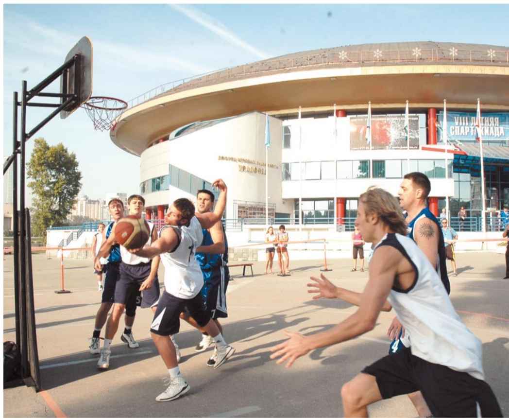
«Газпром добыча Ямбург» (в синей форме) — «Газпром трансгаз Москва»

В рамках турнира по уличному баскетболу для определения чемпиона Спартакиады потребуется провести более 100 матчей. Игруют команды одновременно на четырех площадках, а для финального поединка будет оборудовано специальное игровое поле с трибунами для болельщиков. Впрочем, об этом говорить пока еще рано. Открылся же турнир 20 августа в 10 часов утра. В тот момент сразу на трех площадках свои матчи начали чемпион, серебряный и бронзовый призеры Спартакиады «Газпрома» 2007 года. На площадке № 1 обладатели золотых наград предыдущих спартакиадных