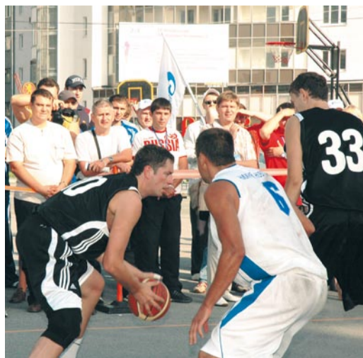
«Газпром трансгаз Нижний Новгород» (в белой форме) — «Газпром трансгаз Екатеринбург»

Игр — баскетболисты московской команды — экзаменовали соперников из Ямбурга. Серьезной борьбы не получилось: москвичи не оставили шансов своим менее титулованным соперникам — 13:5.