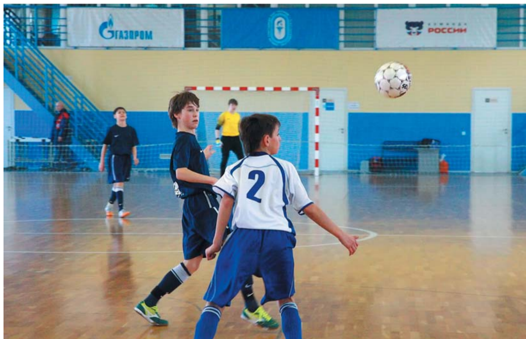
...но мимо кого-то он пролетает и мчится к более достойным

Впрочем, этим дублем забивная деятельность Москвы и ограничилась. Второй тайм она проиграла 0:4. Постепенно успокоился и уже ничего не говорил своим подопечным столичный тренер. Лишь иногда тихо произносил: