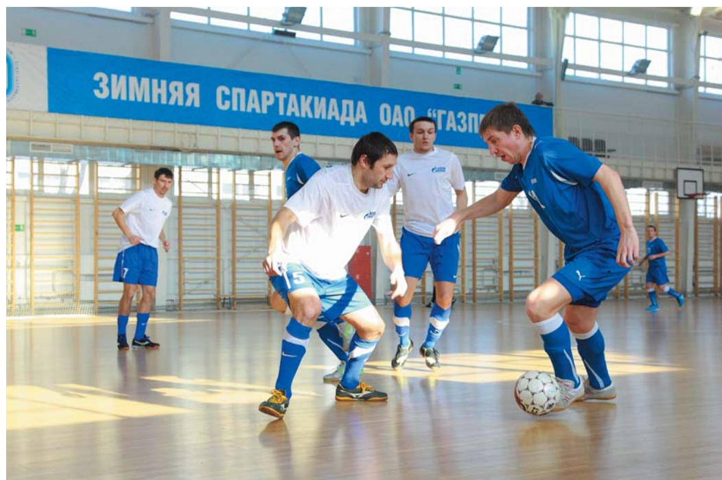
Футболисты Сургута (в синем) уверенно заняли первое место в группе

Однако чуда не произошло: Югорск победил 3:0. Его оборона по итогам группового турнира оказалась самой надежной — всего 4 пропущенных мяча при 42 забитых. Впрочем, в плей-офф про статистику придется забыть. В матчах на вылет нужно просто победить — с любым счетом.