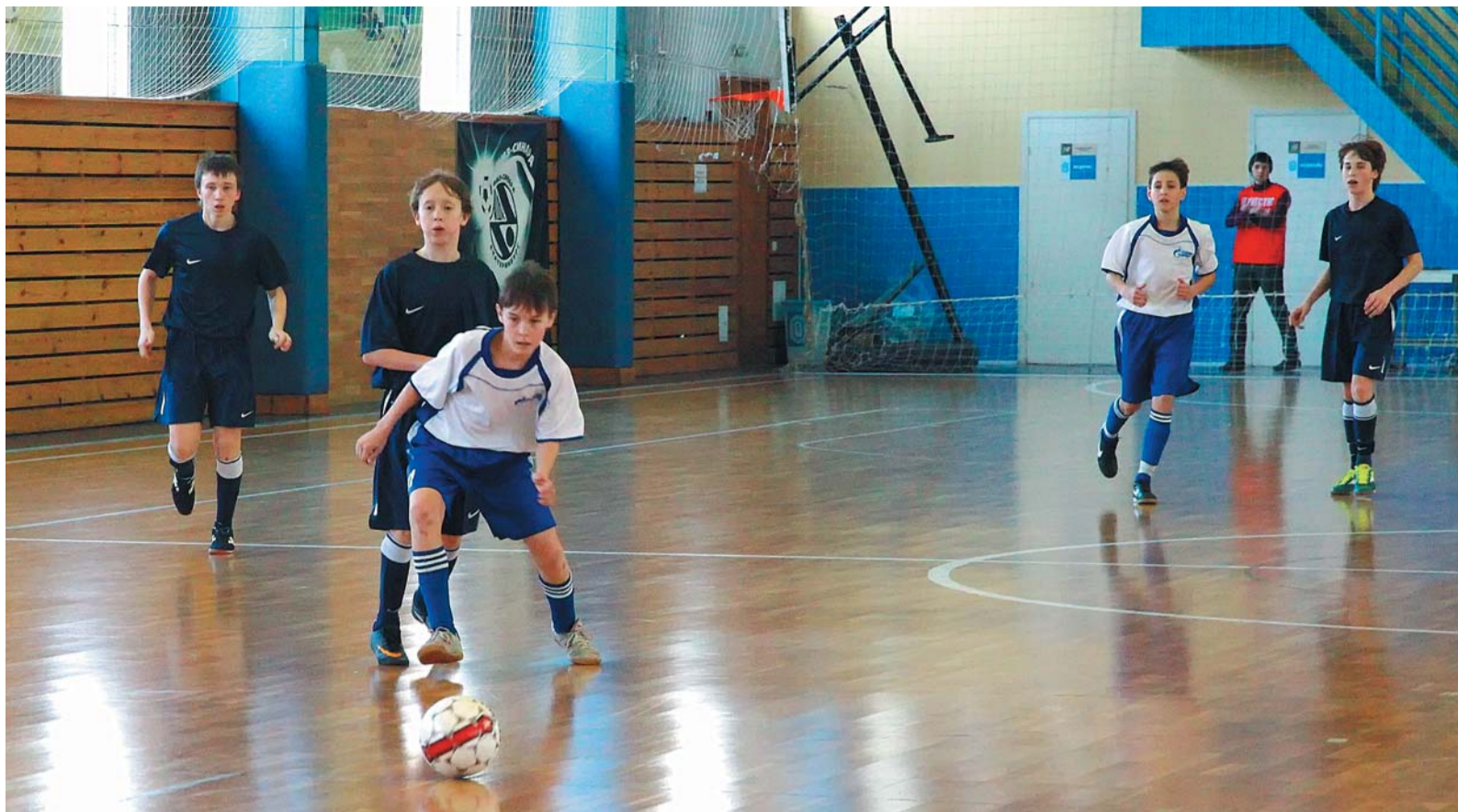
Победа на Спартакиаде подобна мячу — гонятся за ним все...

— Интересно — четвертый игрок забил девятый гол.