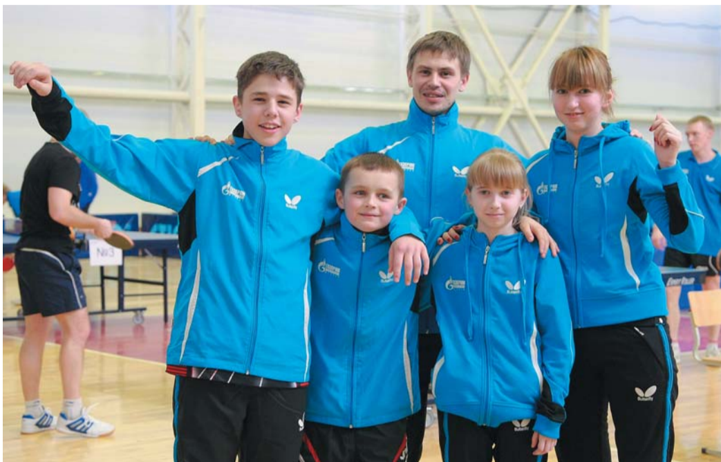
Сборная «Газпром трансгаз Югорск» — чемпион Спартакиады в командном первенстве по настольному теннису

Неудивительно, что после такой битвы оренбуржцы вышли на матч за «бронзу»