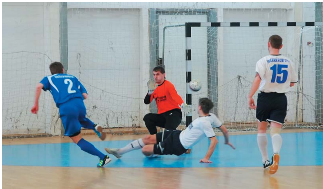
Екатеринбуржцы (в синем) забил три мяча Нижнему Новгороду и вышли в плей-офф

— Оренбуржцев устраивала только победа с преимуществом в четыре мяча. Лишь тогда они попадали в плей-офф. С учетом того, как здесь выступают югорчане, задача почти невыполнимая, — поделился соображениями главный судья соревнований в ФОКе «Верх-Исетский» Виктор Клепиков. — Но в футболе бывает всякое.