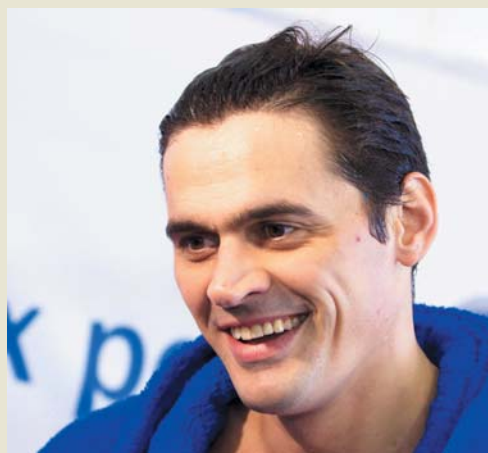
4-кратный олимпийский чемпион А. Попов

В XXI веке реноме свердловской хоккейной школы не пошатнулось. Олимпийский чемпион-1992 Николай Хабибулин первым из российских вратарей стал обладателем Кубка Стэнли. В НХЛ не-