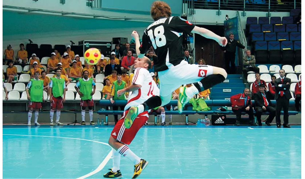
Игроки прославленного екатеринбургского клуба «Синара» составляют костяк нынешней сборной страны по мини-футболу