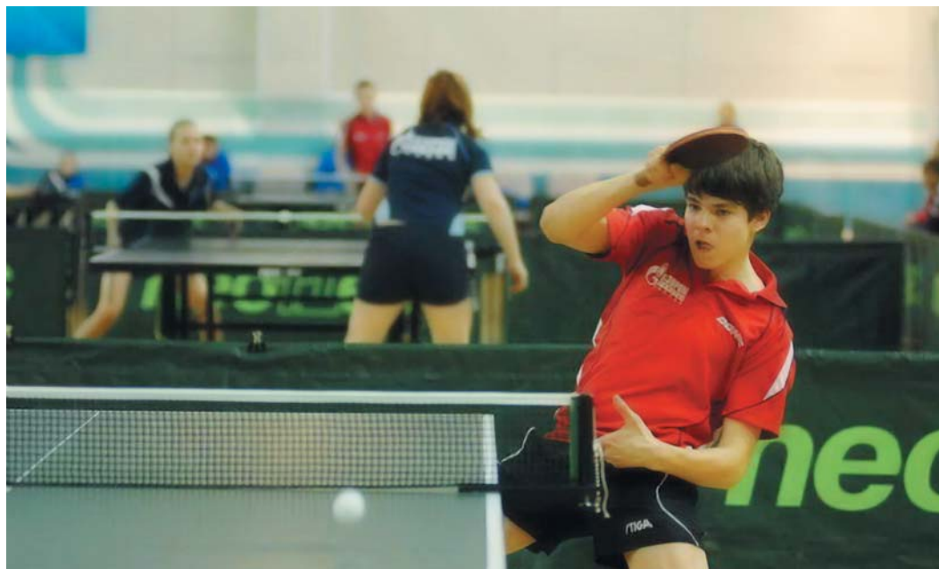
Настольный теннис с самого начала прочно вошел в программу детских спартакиад

в лыжных гонках. Заключительный этап комбинированной эстафеты стал одним из самых запоминающихся событий всей Спартакиады. Томичи вырвали победу в финишном створе, обогнав лыжников из Сургута всего на три секунды. Да и судьба «бронзы» решилась на последних метрах дистанции, когда москвичка лишь на секунду опередила югорчанку. Не повезло тогда и команде