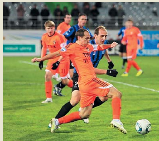
Футбольный клуб «Урал»