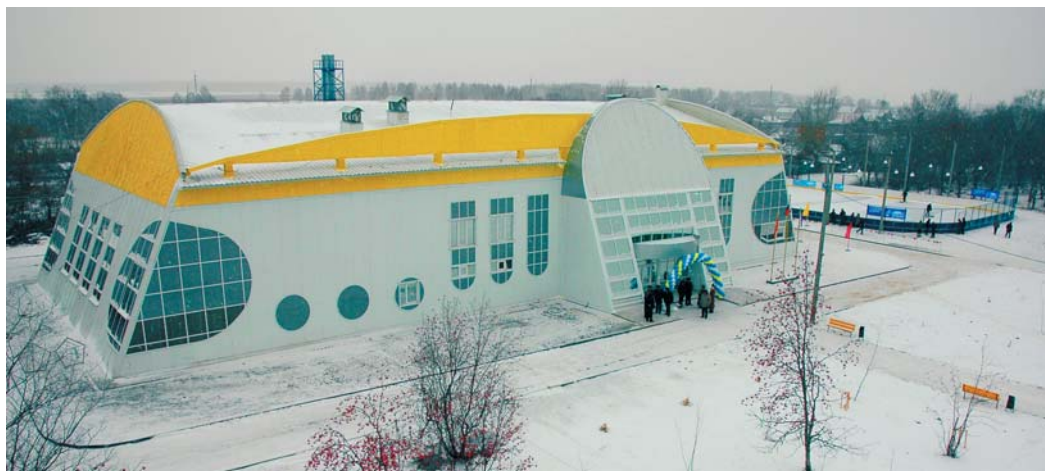
ФОК с бассейном в Красногоске Челябинской области

Не секрет, что особенности расположения объектов газотранспортной системы таковы, что большинство филиалов дочерних Обществ Газпрома базируется рядом с небольшими населенными пунктами. Зачастую это отдаленные села и деревни. Неудивительно, что весь груз социальной ответственности и заботы о развитии инфраструк-