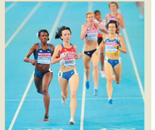
Чемпионка мира по бегу на дистанции 800 м М. Савинова