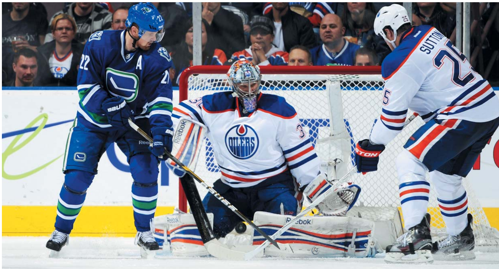
Воспитанник свердловской хоккейной школы, олимпийский чемпион-1992 Николай Хабибулин первым из российских вратарей стал обладателем Кубка Стэнли

Другой армейский клуб — по хоккею с мячом — тоже стал культовым. Основанный в 1946-м маршалом Жуковым, он является 12-кратным чемпионом страны и обладателем Кубка европейских чемпионов-1975. Чемпионами мира в разные годы становились почти два десятка армейцев, но самым известным из них по праву считается Николай Дураков. Живая легенда отечественного спорта имеет 93 медали разного достоинства, семь из них — «золото» мирового первенства, что является непревзойденным достижением за всю историю хоккея с мя-