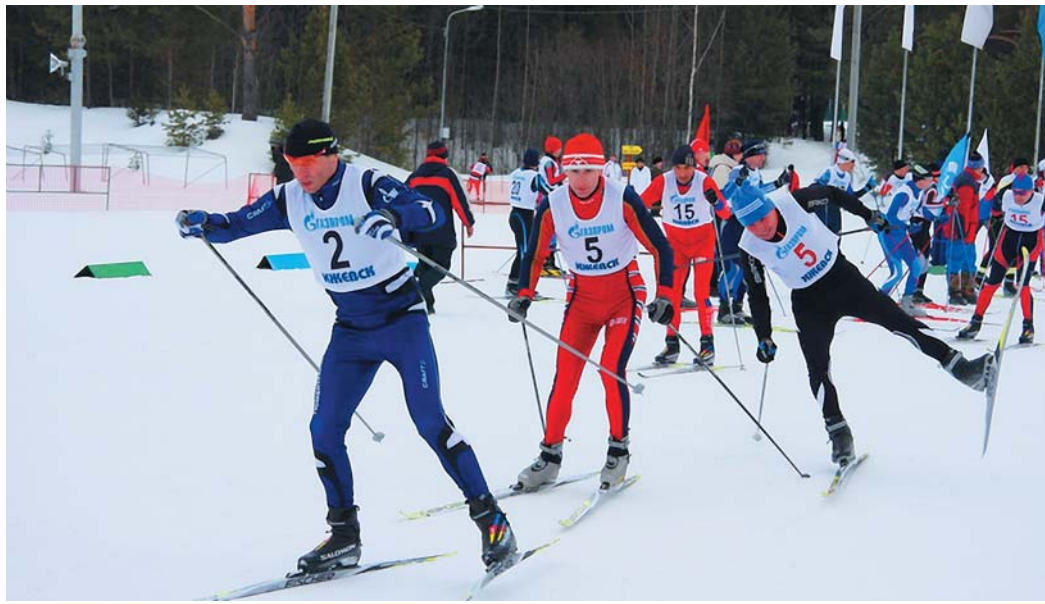
На VII зимнюю Спартакиаду работников ОАО «Газпром» в столице Удмуртии съехались 25 сборных

В 2001 году количество команд увеличилось еще на одну, и произошли первые изменения в программе: туризм и хоккей сменились армспортом и шахматами. Отсутствие хоккея не отпугнуло трехкратного олимпийского чемпиона Владислава Третьяка, который вместе с четырехкратной олимпийской чемпионкой Галиной Кулаковой пожаловал в гости к участникам и гостям Спартакиады. Кстати, великая лыжница затем неоднократно приезжала в Ижевск. Что до спортивных ито-