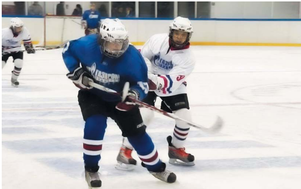
На последней зимней Спартакиаде в Югорске юные хоккеисты поразили ворота 295 раз

Зато Томск, обидно проехавший мимо медалей в хоккее, праздновал успех