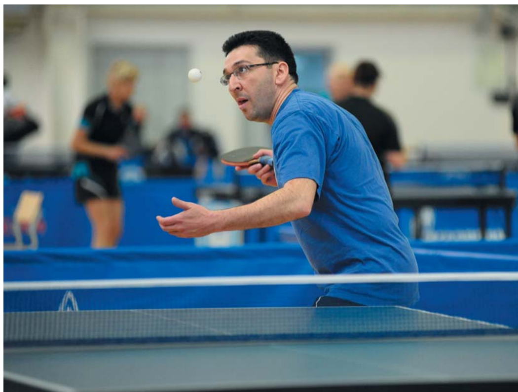
Точка отсчета — точка подачи

Сегодня состоятся заключительные поединки в группах, которые и определят тех, кто в дальнейшем продолжит борьбу за медали, и тех, кому предстоит уже встретиться в матчах за утешительные места.