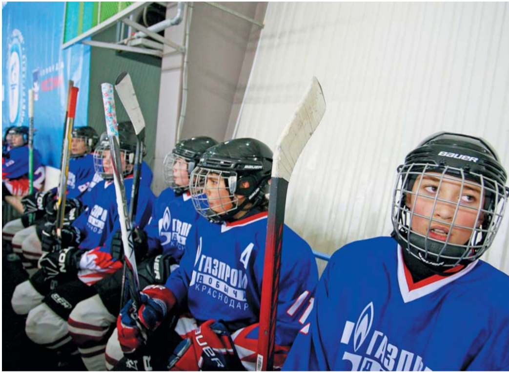
Игроки Краснодара в ожидании будущих побед

— Активированный. Это когда мы в школу не ходим из-за морозов. Зато теперь благодаря теплым зимам тренировки не срываются. Мы же занимаемся на открытом катке: крытую арену нам еще строят.