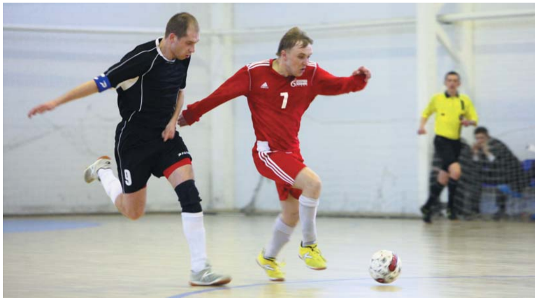
В этот день футболисты «Газпром добыча Надым» (в красном) одержали две победы