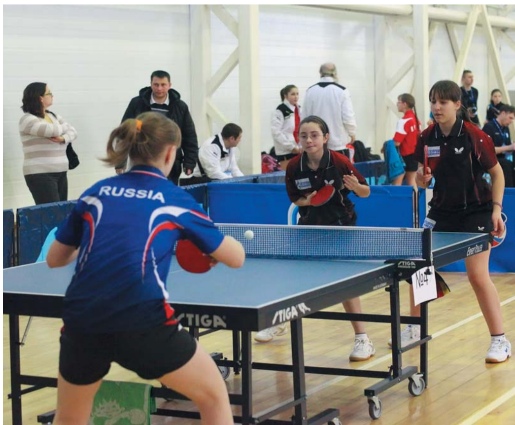
Командный турнир по настольному теннису стартовал

В результате, в первой группе лидерство себе обеспечила великолепная четверка, представляющая «Газпром транс-