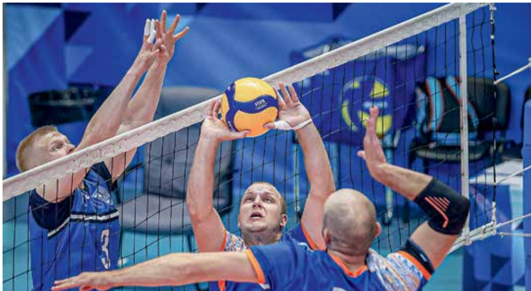
Некоторые розыгрыши длились больше минуты, партии доходили до 30 очков

К счастью, обошлось без серьезных повреждений у игроков. Разве что неприятный осадок у тех, кто свои решающие матчи выиграть не смог. Но что там были за зарубы! Некоторые розыгрыши длились больше минуты, партии доходили до 30 очков, а реша-