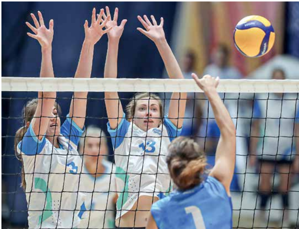
Здесь было все — упорная борьба и невероятные спасения

Не менее драматичной получилась встреча команд «Газпром трансгаз Томск» и «Газпром трансгаз Югорск». О напряженной борьбе лучше всего говорит итоговый счет первой партии — 29:27 в пользу Югорска. Томички, которые прошли групповой этап без поражений, сдаваться были не намерены, но и вторая партия им не удалась. Несколько раз казалось, что сибирячки смогут сравнять счет в матче, но Югорск своего не упустил и благодаря уверенной игре у сетки одержал победу в матче, отправив томскую команду в матч за 5-8-е места.